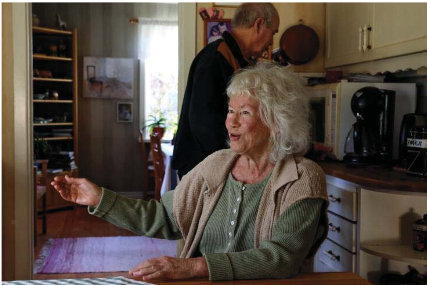
Biggan berättar entusiastiskt om KLIV 94 och andra kulturprojekt.